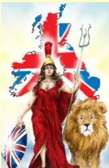
A Britanniát megszemélyesítő nőalak a Dávid-házi Tea Tephit kívánja ábrázolni.